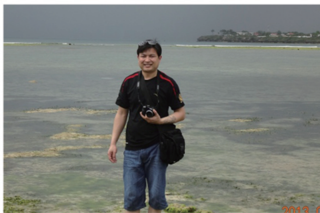
连续奋战十二小时

今夏入伏以来，全国多次进入了“烧烤模式”，温度屡创新高。就在人们想尽办法寻找清凉之时，中复连众的一线员工们却在高温和烈日下挥汗忙碌，坚守在各自的岗位，没有一句怨言。