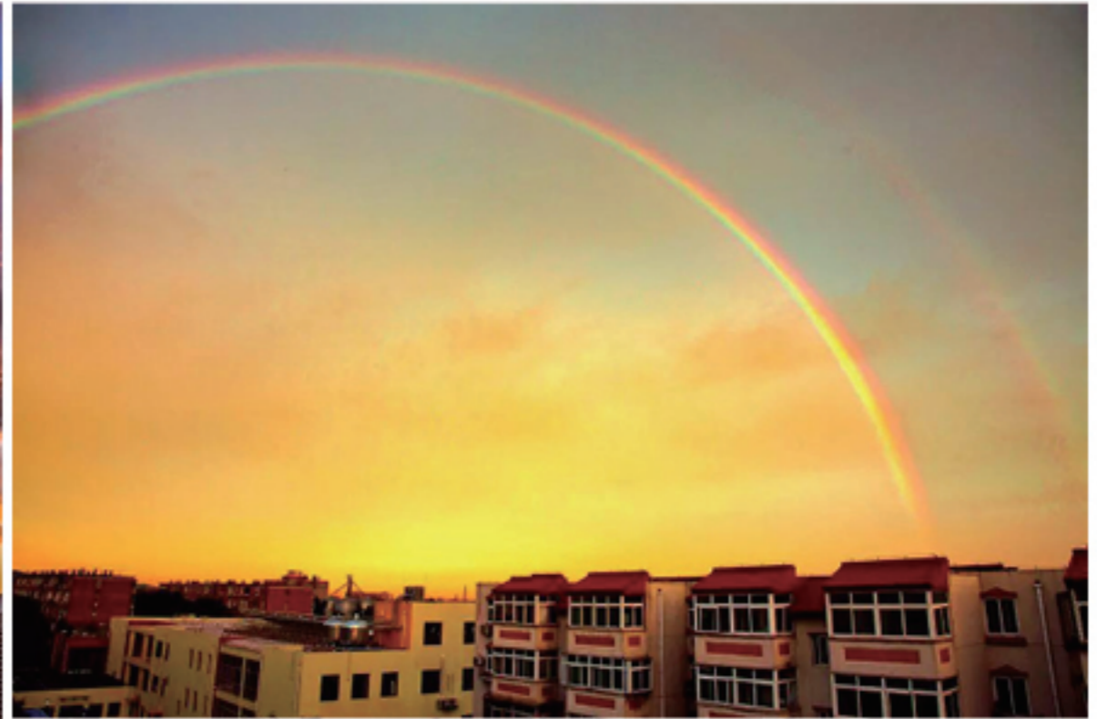
《醉美北京》 拍摄时间：2015年8月3日