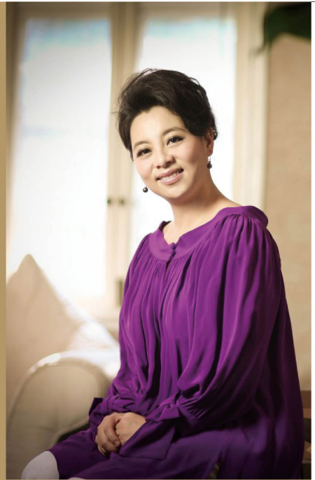
六六（女作家，著有《蜗居》等）